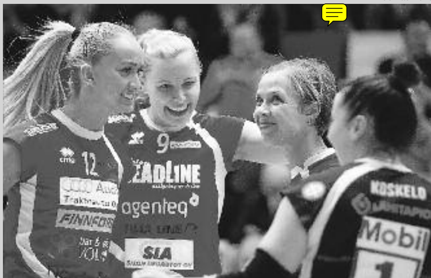
LP Viesti on kaikkien aikojen ensimmäinen suomalainen seura, joka pääsee mukaan lentopallon Mestarien liigaan.