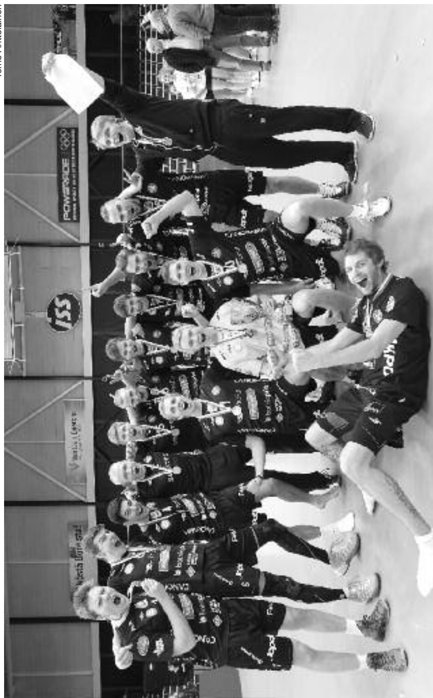
Kokkolan Tiikerit taisteli Suomen Cupin 2013 voiton Vantaan Energia Areenalla.