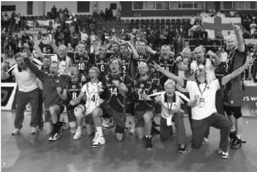
Miesten maajoukkue juhlii MM-kisapaikan varmistumista karsintaturnauksessa Popradissa, Slovakiassa tammikuussa 2014.