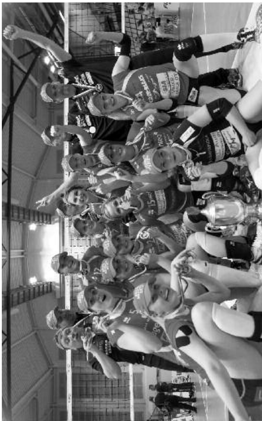
LP Viesti otti kuudennen peräkkäisen mestaruutensa keväällä 2014.