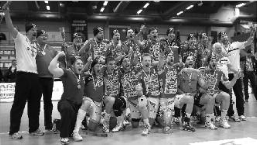
Vammalan Lentopallo juhlii Suomen mestaruutta kaudella 2013-2014.