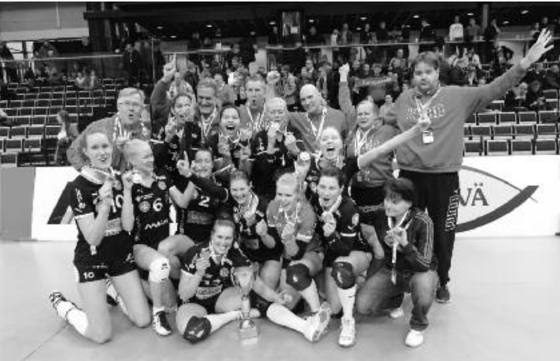
LP Kangasala juhli toisen kerran peräkkäin naisten Suomen Cupin 2013 finaalissa Vantaalla.