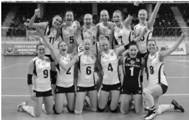
Naisten maajoukkue taisteli EM-karsinnoissa, mutta kisapaikka jäi vielä ottamatta.