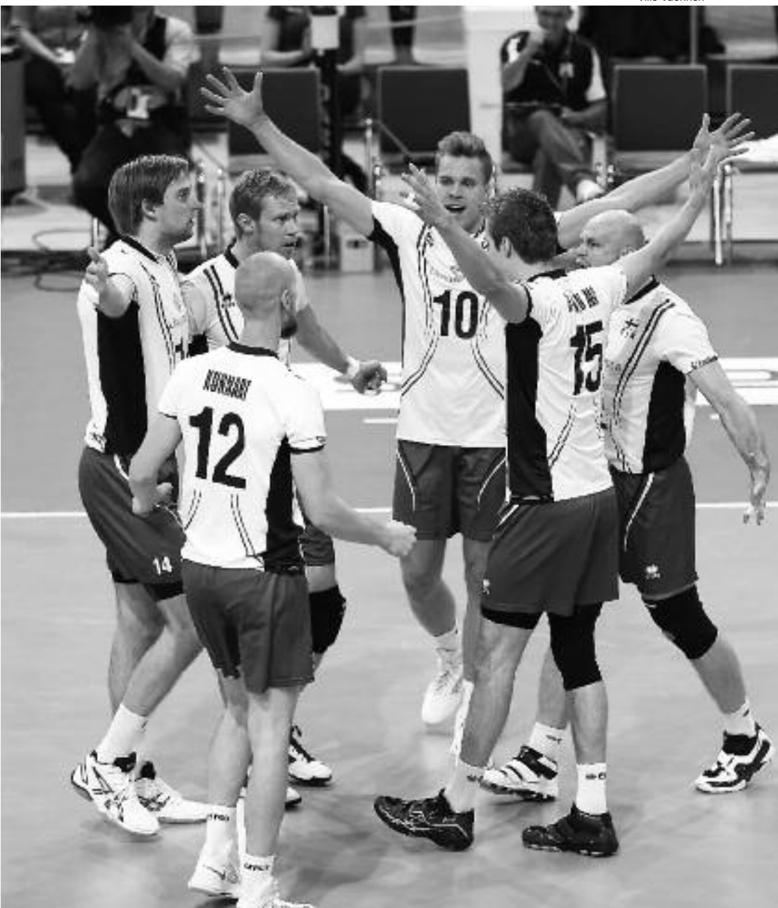
Syksyn 2013 EM-kisoissa Suomi meni hienosti puolivälieriin, joissa kuitenkin Italia oli vahvempi.